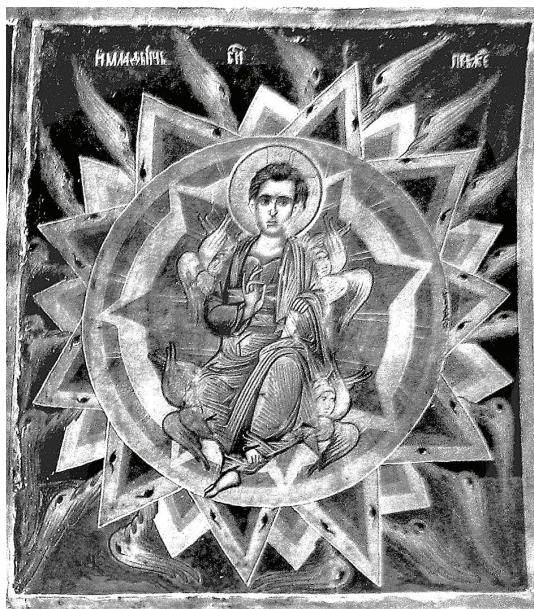
Рис. 6. Спас Еммануил во Славе. Фреска церкви Рождества Богородицы в с. Сливница (Македония). 1611–1612 гг.

в мандорле, и даже спинка престола. На последней, кроме глаз, начертаны слова сѣъ сѣъ сѣъ , что добавляет еще и профетологическую и литургическую окраску.