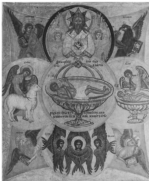
Рис. 5. «Литургия» Оборот запрестольной иконы «Богоматерь Гора нерукосечная». 1691 г.

силахъ» (рис. 5), но окружающие его ангелы подписаны отдельно: «херувими», а ангелы в нижнем круге — «серадими».