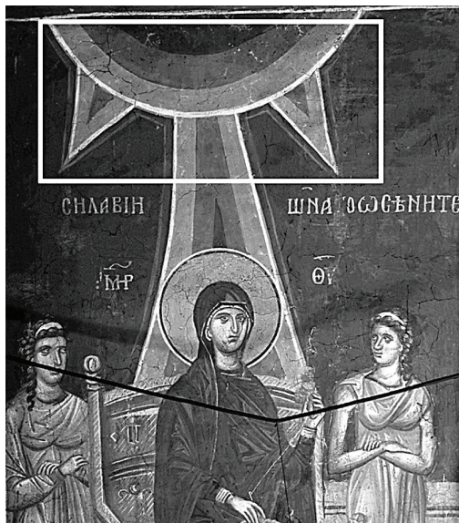
Рис. 7. Фреска в жертвеннике церкви Христа Пантократора. Монастырь Дечаны (Сербия), 1345–1348 гг. (прямоугольником выделены рассматриваемые в тексте детали)

«творческая Сила Всевышнего» (ἡ δημιουργικὴ δύναμις τοῦ Ὑψίστου 92 ); «Сила» разделяется на четыре «части» (стороны, направления, по странам света) и касается «твари»: в южнославянском переводе — четырьмя краями; в древнерусском — несколько иначе; она касается четырех концов мира (и косууса четьремъ оугломъ твари; каи ѿшато тѡν τεσσάρων ᾠγωνῶν τῆς κτίσεως ), после чего кости умерших соединяются и они встают 93 . Описанная огненная «Сила», растянувшаяся на четыре конца земли, находит соответствие в красной четырехконечной «звезде» на иконах Спаса в Силах; обратим внимание, что в ее «лучах» («углах») размещены апокалиптические «животные», символизировавшие, кроме Евангелий, еще и страны света 94 .