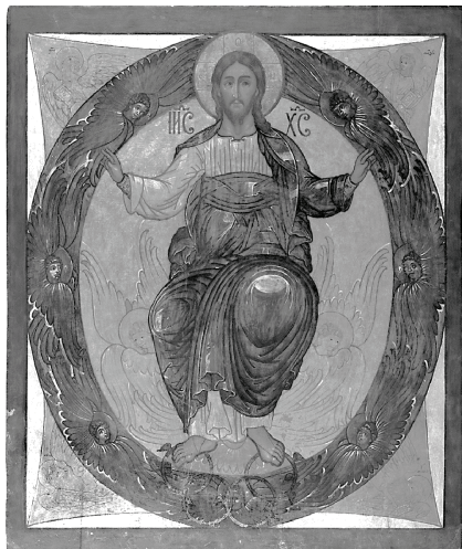
Рис. 1. «Спас в Силах» (на херувимах). Средник деисусного чина из Ильинской церкви г. Белозерска. XVII в.

Иконография имеет несколько изводов, в том числе классический — Спас, сидящий на престоле, внутри звездчатых фигур, — и вариант без престола (Спас восседает на херувимах), как в среднике ростового деисусного чина из Ильинской церкви г. Белозерска (КБМЗ, инв. ДЖ 1006) (рис. 1). В ряде описей используется формулировка: «Спасов образ в Силах на престоле» 26 . Не исключено, что акцентуация «престола» здесь указывает на то, что составители знали и вариант без престола; возможно, именно такой вариант имеет в виду опись Спасо-Каменного монастыря 1701 г.: «по правую сторону Царских дверей местных образов. Образ Господа Вседержителя, сидящей на херувимех с четырьмя евангелисты» 27 .