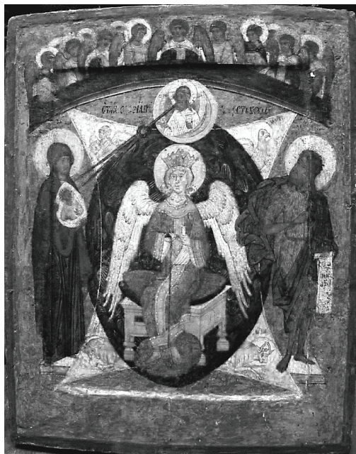
Рис. 4. «София Премудрость Божия в Силах». Икона XVII в.

Но следует обратить внимание на то, что и в названных иконографиях главным внешним отличительным признаком, — который и мог с высокой степенью вероятности дать ей название, — являются вовсе не ангелы, а именно красные четвероконечные «звезды». Позволяю-