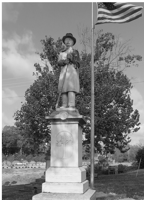
Илл. 2. Памятник «Защитникам суверенитета штата». Скульптор Л.Д. Чайлдс (?). 1891 г. Форт-Милл, Южная Каролина.

Суть различий между типично-северным и типично-южным восприятием Гражданской войны и отмены рабства прекрасно передают два памятника — в Бостоне и городке Форт-Милл в Южной Каролине, подобных которым по вложенному в них смыслу очень много, соответственно, на Севере и Юге США. На бостонском памятнике «Освобождение рабов» (скульптор — африкано-американка Мета Во Уоррик Фуллер, прославившаяся отражением расовой тематики в своем творчестве), в героических позах запечатлены несколько черных людей (илл. 1). Памятник был создан в гипсе в 1913 г. в ознаменование 50-летия Прокламации об освобождении рабов, а в 1999 г. отлит в бронзе и установлен в мемориальном парке, носящем имя выдающейся черной аболиционистки Гарриет Табмен. В 2013 г., к 150-летию Прокламации, на постаменте появились торжественные слова, посвященные увековеченному монументом событию. На памятнике же в Форт-Милле (1891 г.), также являющемся частью мемориала — Парка Конфедерации, запечатлен в спокойной, исполненной достоинства позе одинокий белый солдат, а надпись на постаменте гласит: «Защитникам суверенитета штата»