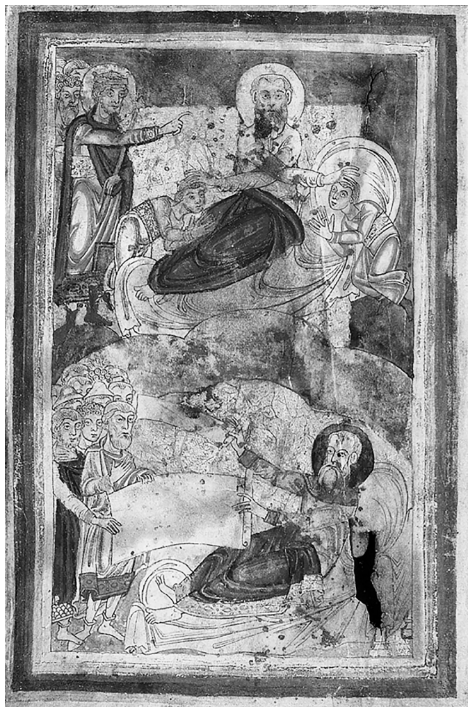
Илл. 2. Лист Витгерт, ок. 1150–1170 гг. Библиотека университета, Льеж, Ms. 2613 ( http://hdl.handle.net/2268.1/4796/ )