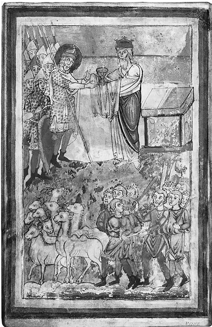
Илл. 4. Лист с сюжетными композициями, ок. 1150-1170 гг. Музей Виктории и Альберта, Лондон, Ms. 413 ( https://collections.vam.ac.uk/item/O125624/manuscript-cutting-unknown/ )