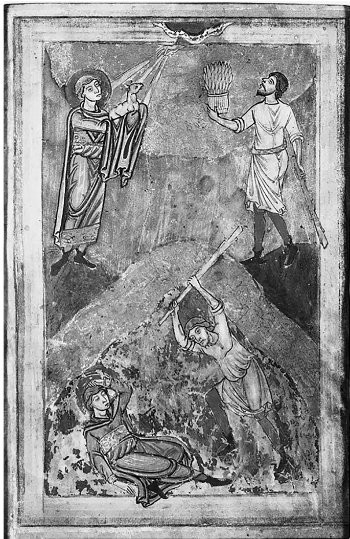
Илл. 3. Лист с сюжетными композициями, ок. 1150–1170 гг. Музей Виктории и Альберта, Лондон, Ms. 413 ( https://collections.vam.ac.uk/item/O125624/manuscript-cutting-unknown/ )