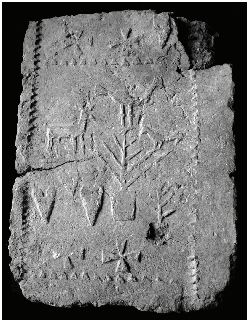
Рис. 5. Лицевая сторона кирпича, обнаруженного при разборке здания в Friedland/Правдинске (Фонды музея-выставки «Колесо истории», г. Светлогорск).