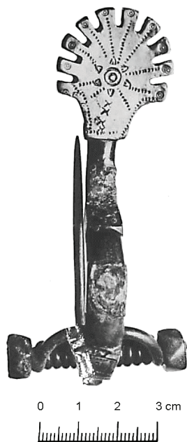
Рис. 1. Бронзовая, с серебряным покрытием фибулы из погр. Мi-273 могильника Mingfen/Miętkie (Кулаков В.И., 2011, рис. 26).

Данные прусской археологии, в последние десятилетия серьезно пополнившиеся, позволяют увидеть изображения деревьев, сакрализованных раннесредневековыми обитателями Янтарного края. Древнейшее, весьма стилизованное изображение дерева, — на фибулах типа Bitner-Wróblewska II, относящихся в древностях поздних эстиев и ранних пруссов к фазам C 2 /D 1 6 , т.е. к началу эпохи Великого переселения народов. Семь лет тому назад автор этих строк выдвинул гипотезу о том, что корпус звёздчатых фибул представляет собой стилизованное изображение дерева, в кроне которого помещен солярный знак (рис. 1). Эта догадка была подкреплена данными балтской этнографии и фольклористики, которые сообщают о мифе, согласно которому в кроне