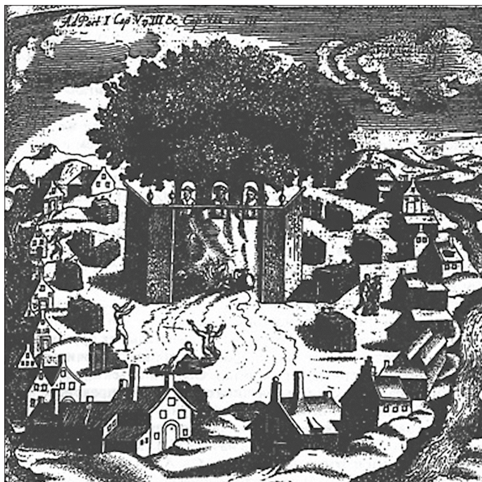
Рис. 4. Ромове — центральное святилище пруссов (по К. Харткноху, 1684 г.) (Кулаков В.И., 2003, с. 198, рис. 68).

музея Л. Быстровой с уникальной находкой, поступившей в фонды этого музея из Friedland/Правдинска. Это большемерный кирпич, происходящий из руин разобранного строения в упомянутом городе. К сожалению, более точный адрес находки остался неизвестным. Т.к. большемерные кирпичи появляются в Пруссии в эпоху существования Орденского государства, дату этой находки условно можно отнести к хронологическому отрезку XIV–XVII вв. На одной из сторон кирпича по сырой глине при помощи деревянной (на это указывают «рубленные» линии рисунка) формы была оттиснута довольно сложная композиция (рис. 5). В центре ее представлено дерево с семью безлистными ветвями (вытянуты под углом вверх). На вершине дерева помещен петух (?), справа от дерева — конь, обращенный к дереву, слева — олень (также головой к дереву). За крупом коня представлено небольшое дерево, под ногами оленя — три схематически