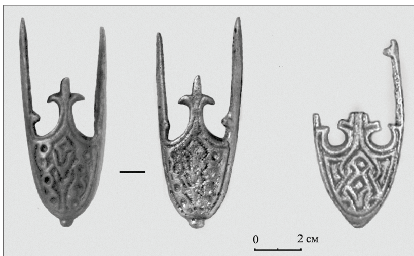
Рис. 6. Бронзовые наконечники ножен мечей подтипа Kazakevičius Vb: слева — Andullen/Anduliai, Klaipeda raj., Lietuva, справа — Kaup, г. Зеленоградск (Кулаков В.И., 2012, рис. 143).

времени, что претерпел многократную стилизацию (рис. 6, справа), вплоть до полной деградации рисунка. На первичном этапе изготовления наконечников подтипа Kazakevičius VIb куршские мастера четко выдерживали композицию рисунка, очевидно, следуя какому-то изобразительному канону. Этот канон отличался от описанного выше прусского канона тем, что священное дерево охраняли не олень и птицы, а драконообразные существа (змеи ?).