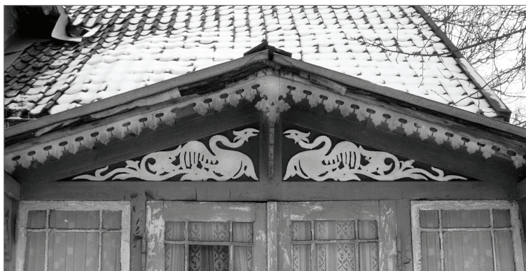
Рис. 7, 8. Детали фронтонов домов конца XIX — начала XX в. в Czanz/Зеленоградске