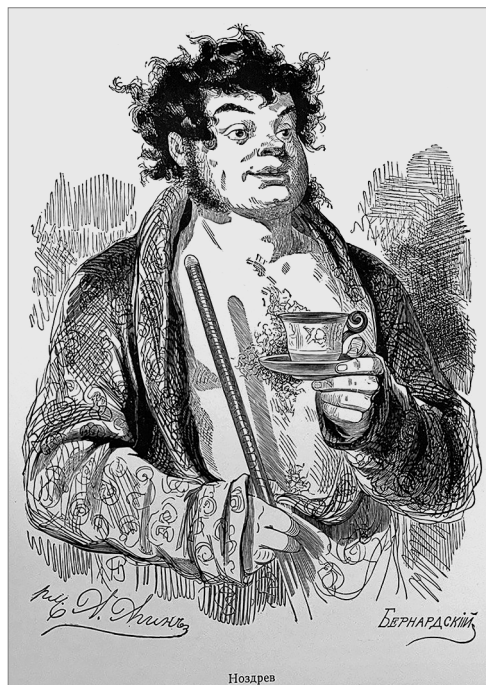
Рис. 2. Ноздрев. Художник А.А. Агин, гравёр Е.Е. Бернадский (Стернин Г.Ю. Александр Алексеевич Агин, 1817–1875. М., 1955. С. 65)

Агин и Бернадский работали вместе — первый создавал рисунки, второй же исполнял по ним гравюры. Портрет А.Ф. Митрохина был исполнен в той же стилистической манере, что и остальные рисунки Агина, которые также напоминают его персонажей к «Мертвым душам» (рис. 2) Н.В. Гоголя 11 .