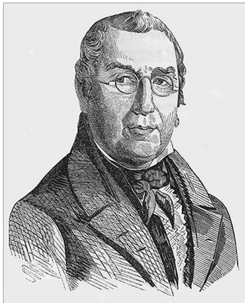
Рис. 1. Андрей Филиппович Митрохин (Кукольник Н.В. Андрей Филиппович Митрохин // Иллюстрация: Еженедельное издание всего полезного и изящного. 1846. Т. 2. № 14. С. 220)

Но самым примечательным в этой публикации является портрет А.Ф. Митрохина, помещенный в центре страницы (рис. 1). Образ скромного труженика трогает душу, и, безусловно, прекрасно дополняет текст.