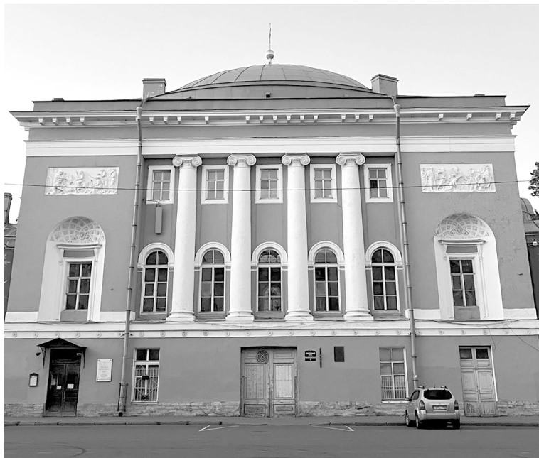
Рис. 3. Церковь Спаса Нерукотворного образа на Конюшенной площади.

представляется последний, ведь в 1792 г. 23 апреля Митрохин «поступил в ведомство Конюшенной команды стряпчим конюхом» 35 .