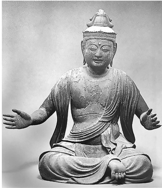
Рис. 2. Один из будд группы «Будда Амида и двадцать пять бодхисатв», храм Сокудзэ-ин, монастырь Сэннюдзи, Киото (конец XI в., XVII–XVIII вв.)

привлекает внимание фигура бодхисаттвы, двумя руками бьющего в барабанчик коцудзуми, при этом одна его ступня выдвинута вперед и напряжена (рис. 2). Следует, однако, учитывать, что первоначальное расположение фигур в скульптурных группах неизвестно. Сейчас все бодхисаттвы расположены строго фронтально. Возможно, первоначальная расстановка создавала более динамичный эффект 36 . Интересный момент современной экспозиции: в павильоне включена запись музыки (реконструкции средневековой музыки Японии). Безусловно, и в древности звучание реальных инструментов дополняло впечатление от музицирующих бодхисаттв. Музыкальные инструменты и символика этого подтипа иконографии подробно разобраны в статье М.В. Есиповой «Музыка двадцати пяти бодхисаттв (музыкальный аспект японской амидаистской живописи райго:дзу)» 37 . Автор интерпретирует подобные композиции как воплощение идеи «Высшей радости», с которой ассоциируется будда и его Чистая земля.