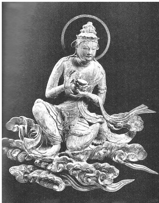
Рис. 1. Один из бодхисаттв с внутренних стен монастыря Бё:до:ин, г. Удзи (1054 г.)

бражением, названным в источнике «Изображение девяти способов возрождения» 九品往生図 Кухон о:дзё: дзу 15 . Возможно, свиток был привезен из Китая японскими паломниками. Эту линию мы можем проследить дальше — род Фудзивара стал создавать крупные ансамбли, в которые композиция была инкорпорирована: несохранившийся Мурё:дзюин монастыря Хо:дзё:дзи (Фудзивара-но Митинага, 1022 г.), павильон будды Амиды монастыря Бё:до:ин (Фудзивара-но Ёримити, 1054 г.) и др.