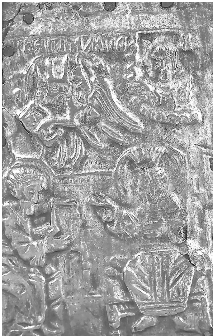
Рис. 4. Евангелист Лука и его символ в виде трехликого вола. Наугольник оклада напрестольного Евангелия. Пермская художественная галерея (ПГХГ, инв. № ДМ-5, РК-757/2). Сольвыгодск (?), строгановские мастерские. Начало XVII в.