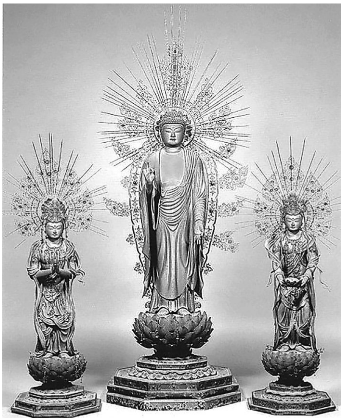
Рис. 6. Триада будды Амиды, монастырь Ко:дай-ин (Ко:ясан) (первая четверть XIII в.). Скульптор Кайкэй

специфические облака благовоний, делящиеся на отдельные струйки и завитки, больше всего напоминают облака на свитке из монастыря на г. Ко:ясан и многих других памятниках. Можно представить, что изображенные или скульптурные облака «взаимодействовали» с дымом благовоний во время практики созерцания или ритуального чтения сутр и умножали эффект чудесного явления фигур перед верующим, парения в воздухе и стирания границ между изображением и смотрящим человеком.