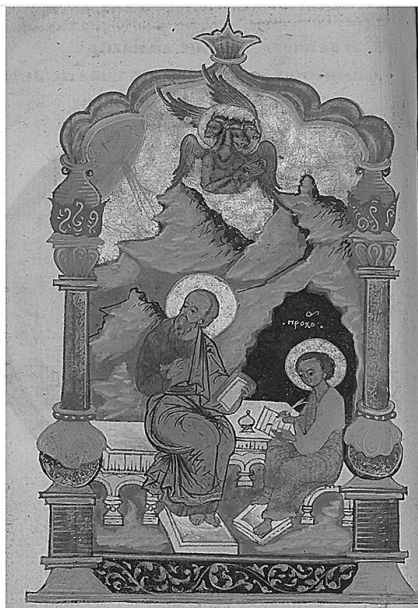
Рис. 3. Миниатюры Тетраевангелия (РНБ, Сол. 144/144). Конец XVI в. Евангелист Матфей. Л. 11 об.; евангелист Марк. Л. 93 об.; евангелист Лука. Л. 146 об.; евангелист Иоанн Богослов и Прохор. Л. 230 об.