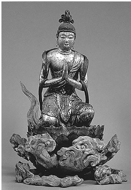
Рис. 4. Бодхисаттва Сэйси из триады будды Амида из храма Дзё:сё:ко:дзи, Киото (XII в.)

межуточные» позы мы уже видели на свитке из Рэйхо:кан. На наш взгляд, они призваны показать явление в процессе, через эффект живой реакции создать ощущение связи между предстоящим и священными персонажами.