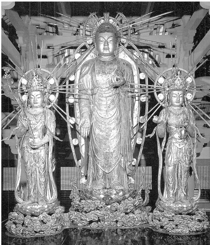
Рис. 5. Триада будды Амиды, павильон Дзё:додо: монастыря Дзё:додзи, преф. Хёго (1194 г.). Скульптор Кайкэй

личающийся стиль этих статуй сразу бросается в глаза: у персонажей пропорционально большие головы и широкие плечи, лики немного напоминают маски (рис. 5). Учитывая то, что центральная фигура тоже выполнена в масштабе «реального будды» (около 5 м в высоту), эффект получается даже немного подавляющий. Атрибуты и жесты непривычны: Амида протягивает правую руку в жесте дарования, а левую складывает в варианте жеста встречи (соединены большой и средний пальцы) 54 , Каннон держит стебель с цветком лотоса с книжечкой наверху, а Сэйси — сосуд, на их головах массивные короны с маленькими фигурками Амиды. Детали также отличаются: бро-