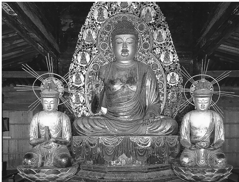
Рис. 3. Триада будды Амиды (с бодхисаттвами Каннон и Сэйси). Павильон О:дзё:-гокураку-ин, монастырь Сандзэн-ин, Киото (1147 г.)

писи внутри фигуры бодхисаттвы Сэйси точно известна датировка создания триады и заказчик — 1147 г., монах Дзицусё. 39