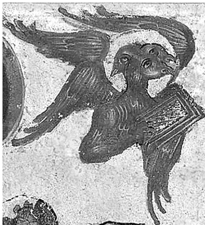
Рис. 1. Орел, символ Евангелиста Марка, под видом трехликого существа. Фрагмент миниатюры «Евангелист Марк и апостол Пётр». Евангелие тетр (РНБ. Сол. 131/131. Л. 154). Вологда, третья четв. XVI в.

В миниатюрах уваровской рукописи и Сол. 131/131 (рис. 2), в отличие от Сол. 144/144, евангелисты держат развернутые вверх свитки вместо кодексов (кроме Иоанна, чьи руки вытянуты в жесте адорации, а свиток держит Прохор) и прибавлены изображения лиц, исторически связанных с тем или иным евангелистом 7 : вместе с еванг. Матфеем — Иаков Брат Господень; с еванг. Марком — ап. Пётр,