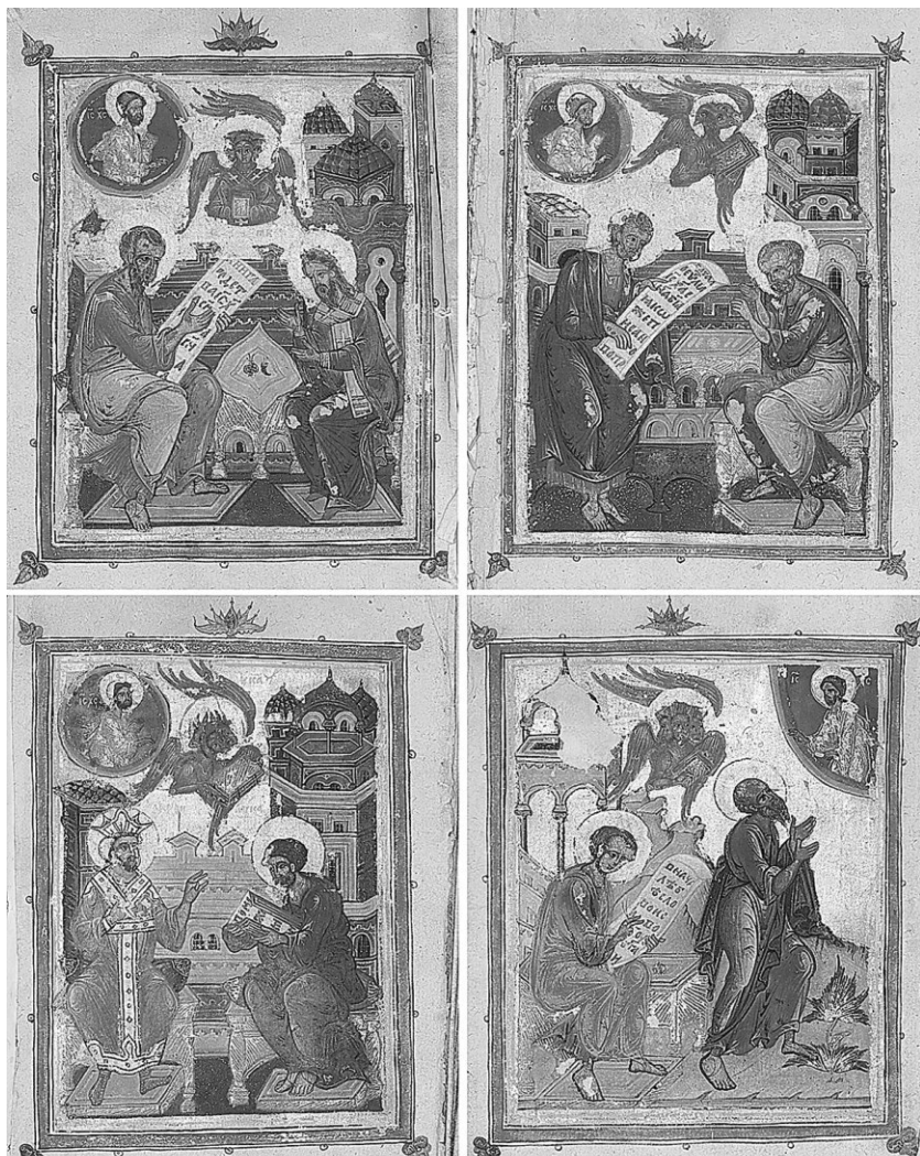
Рис. 2. Миниатюры Четвероевангелия (РНБ, Сол. 131/131). Третья четверть XVI в. Евангелист Матфей и ап. Иаков. Л. 16 об.; евангелист Марк и ап. Пётр. Л. 154; евангелист Лука и Феофил. Л. 244; евангелист Иоанн Богослов и Пророк. Л. 393 об.

с Лукой — Феофил в царском венце. С Иоанном, как обычно, Пророк. Кроме того, присутствует полу-фигура Христа в сегменте неба или в медальоне, плюс — добавлены прямоугольные рамки, укра-